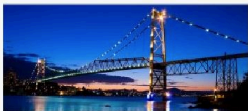
Junto-a-a-noite em: Florianópolis, SC

Acupuntura e suas interfaces na medicina do século XXI